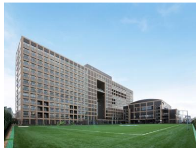
高槻ミューズキャンパス